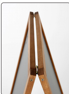
Optional magnets: Model 610