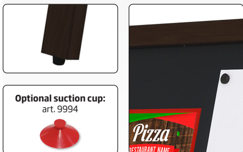
Optional suction cup: art. 9994

A-skilt fremstillet i sortbejdet bøgetræ. Skiltet er monteret med sorte ståltavler, som kan bruges både som skrivetavle og magnettavle. Skiltet er til indendørs og udendørs brug. Markerpenne, magneter og magnetlommer er tilbehør.